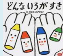
タイトル: どんないろがすき 著者: 100%ORANGE 出版社: フレーベル館