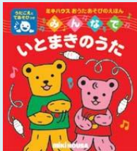
タイトル: みんなでいともぎのうた 著者: おくだちず 出版社: 三起商行

今回は歌絵本の紹介です。一度は耳にしたことがある歌ばかりです。歌いながらページをめくったり、手遊びをしたり、お子様と一緒に楽しんでくださいね♪