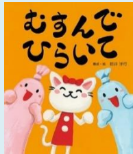
タイトル: むすんでひらいて 著者: 新井洋行 出版社: 瑞雲舎